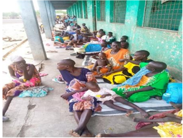
ምስል 4:- ተፈናቃዮች ተጠለለው የሚገኙበት የአሌላ የመጀመሪያ ደረጃ ት/ቤት (ጆር ወረዳ)