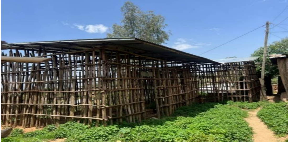
ምስል 7፡ በሐረሪ ክልል ፖሊስ ኮሚሽን ቅጥር ግቢ ለሚገኙ ተፈናቃዮች፣ በአሚር ኑር ወረዳ ገንደፌሮ ተብሎ በሚጠራው አካባቢ የተጀመሩ ቤቶች