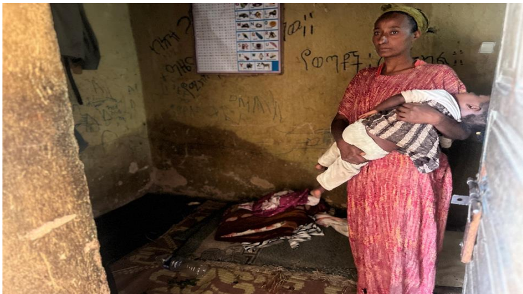
ምስል 2፦ በሐረር ክልል ፖሊስ ኮሚሽን ቅጥር ግቢ ውስጥ የሚገኙ የተፈናቃዮች እየኖሩ ያለበት ሁኔታ ማሳያ