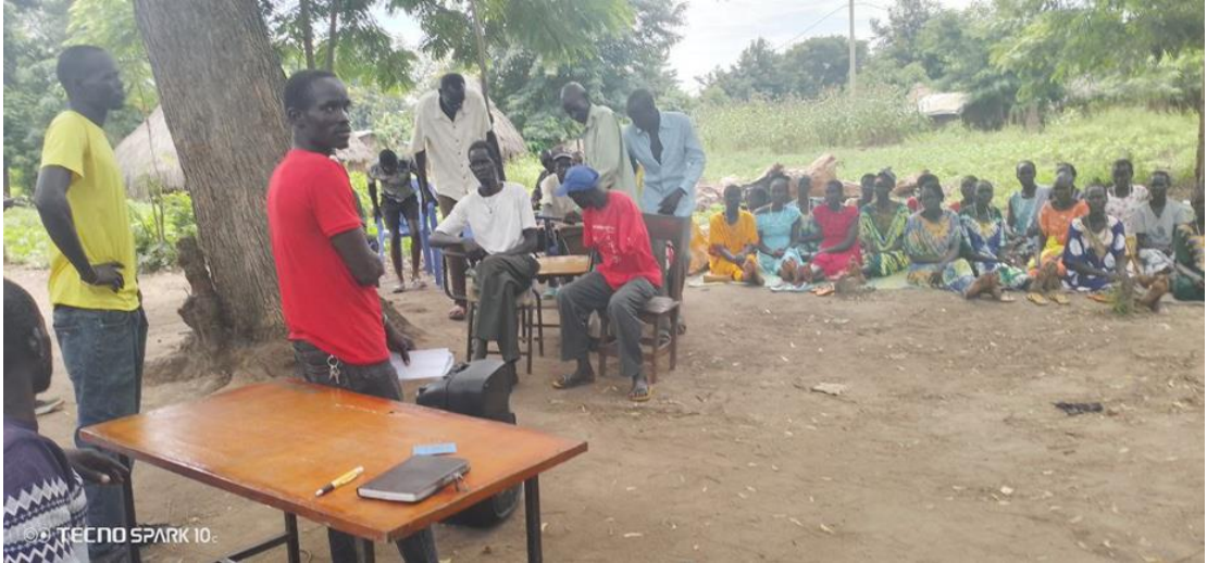
ምስል 5: በጎርፍ ለተፈናቀሉና ልዩ ድጋፍ የሚያስፈልጋቸውን የጎበረተሰብ ክፍሎች ልዩ ቦታ ላይ (ጋምቤላ ዙሪያ ወረዳ)