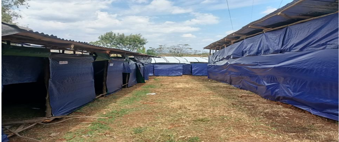
ምስል 3፦ ኦሮሚያ ክልል ምስራቅ ወለጋ ዞን ለተመላሽ ተፈናቃዮች የተዘጋጃ ጊዜያዊ መጠለያ