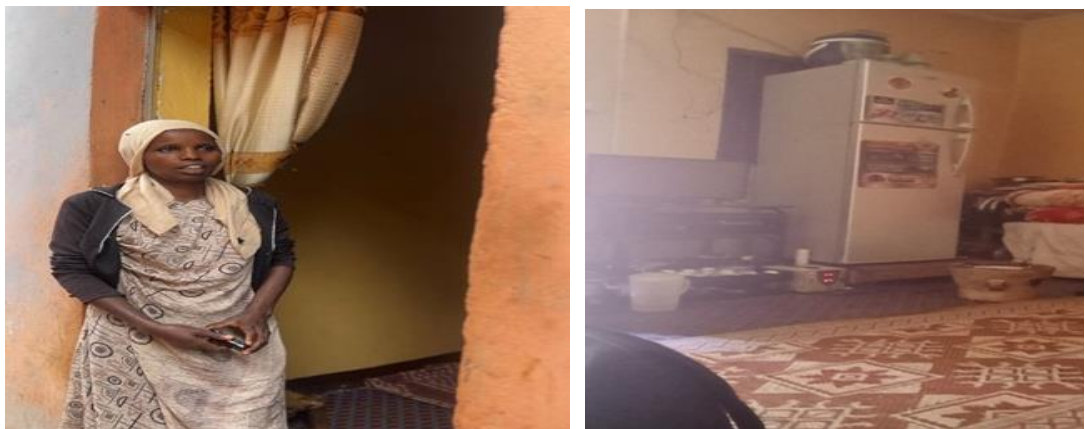
ምስል 6፦ በሐኪም ወረዳ የቀበሌ ቤት ከተሰጣቸው ተፈናቃይ ቤተሰቦች መካከል