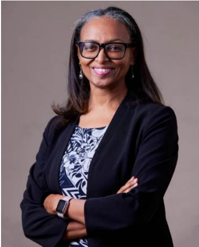
ራኬብ መሰለ ተጠባባቂ ዋና ኮሚሽነር

ይህ የኢትዮጵያ ሰብአዊ መብቶች ኮሚሽን (ኢሰመኮ) ሦስተኛው በሀገር ውስጥ ተፈናቃዮች ሰብአዊ መብቶች አያያዝ ላይ ያተኮረ ዓመታዊ የዘርፍ ሪፖርት ሲሆን፣ ከሰኔ ወር 2015 ዓ.ም. እስከ ሰኔ ወር 2016 ዓ.ም. ድረስ ያለውን ጊዜ ይሸፍናል።