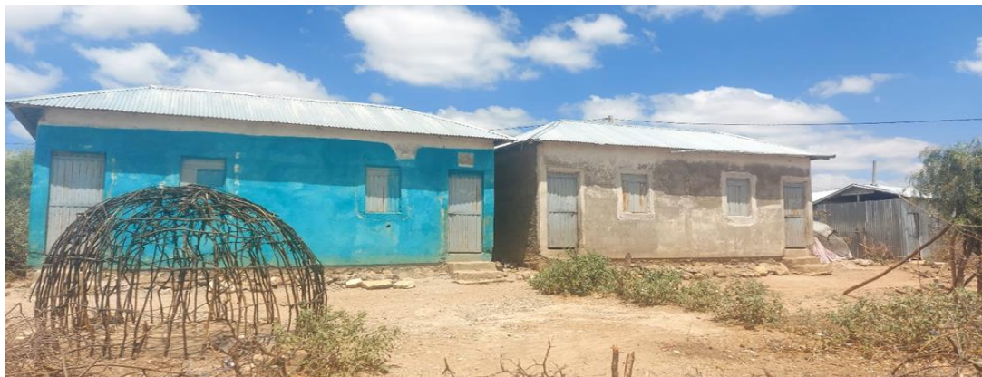
ምስል 8፡ በሶማሊ ክልል ጎልጃኖ ወረዳ ለሰፈሩ ተፈናቃዮች የተሠሩ መኖሪያ ቤቶች በክትትል የተለዩ ክፍተቶች፡